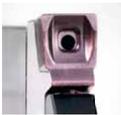
Plaquette de Tronçonnage avec arrosage

Tronçonnages – Alésages - Gorges radiales et frontales – Filetages – Brochages – Outils spéciaux