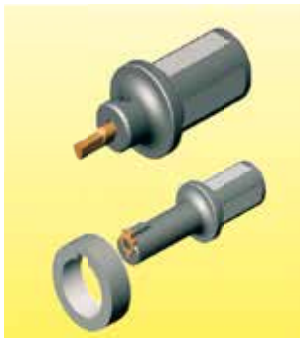
Brochage de 6 pans de 2.5 à 18mm Rainure de clavette de 2.0 à 24mm

Usinage de gorges par interpolation circulaire, filetage par interpolation hélicoïdale