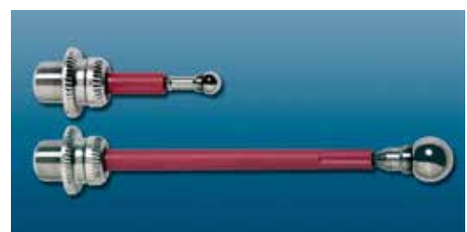
Touche de palpation courte 25 mm, Ø 4 mm/Astina corta Ø 4 mm Touche de palpation longue 65 mm, Ø 8 mm/Astina lunga Ø 8 mm