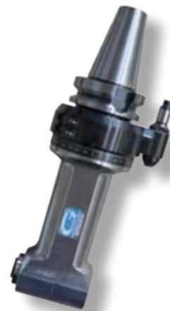
TÊTES A RENVOI D'ANGLE & MULTIPLICATEURS de vitesses