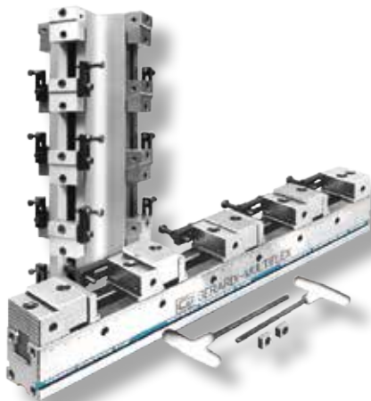
MULTIFLEX Pour serrage de 1 à 12 pièces