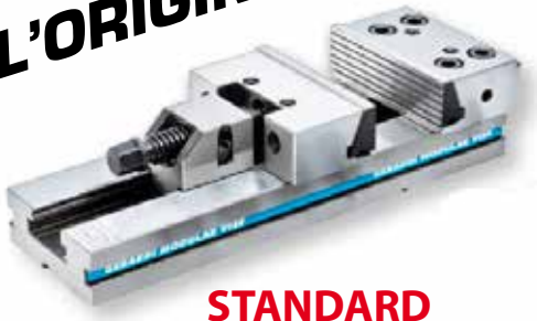
STANDARD Étaux de fraisage à mors plaqueurs