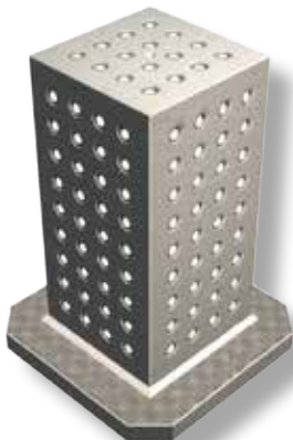
CUBES ET ÉQUERRES